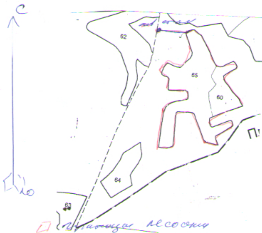
Общая схема участка и его привязки

Технологическая схема (схемы) проведения мероприятия ухода за лесами (рубок ухода, дополнительных лесовосстановительных, противопожарных, лесозащитных и других мероприятий)