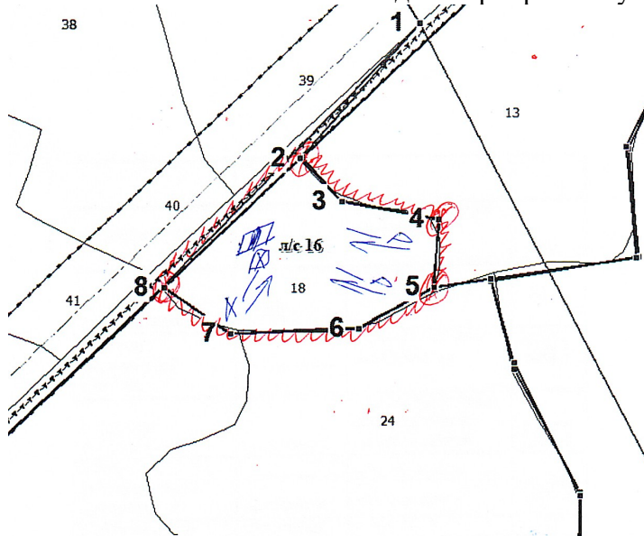
Схема (схемы) выполнения технологических операций по видам мероприятий ухода за лесами