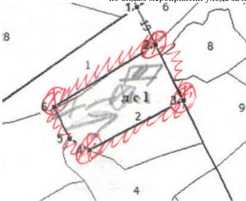
Схема (схемы) выполнения технологических операций по видам мероприятий ухода за лесами