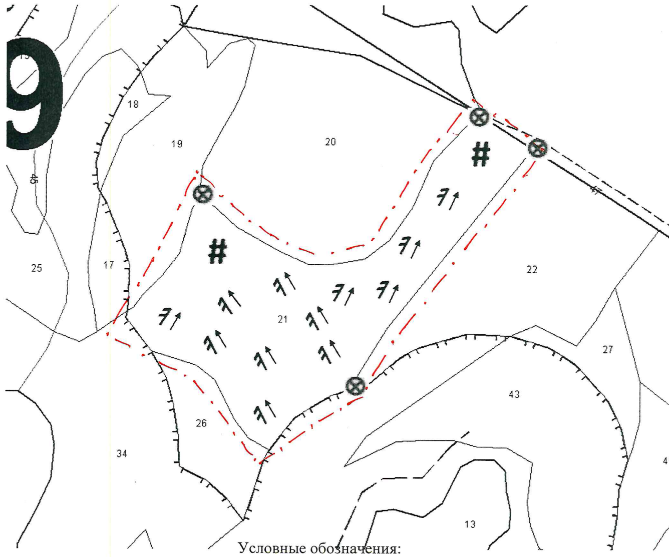
Схема (схемы) выполнения технологических операций по видам мероприятий ухода за лесами