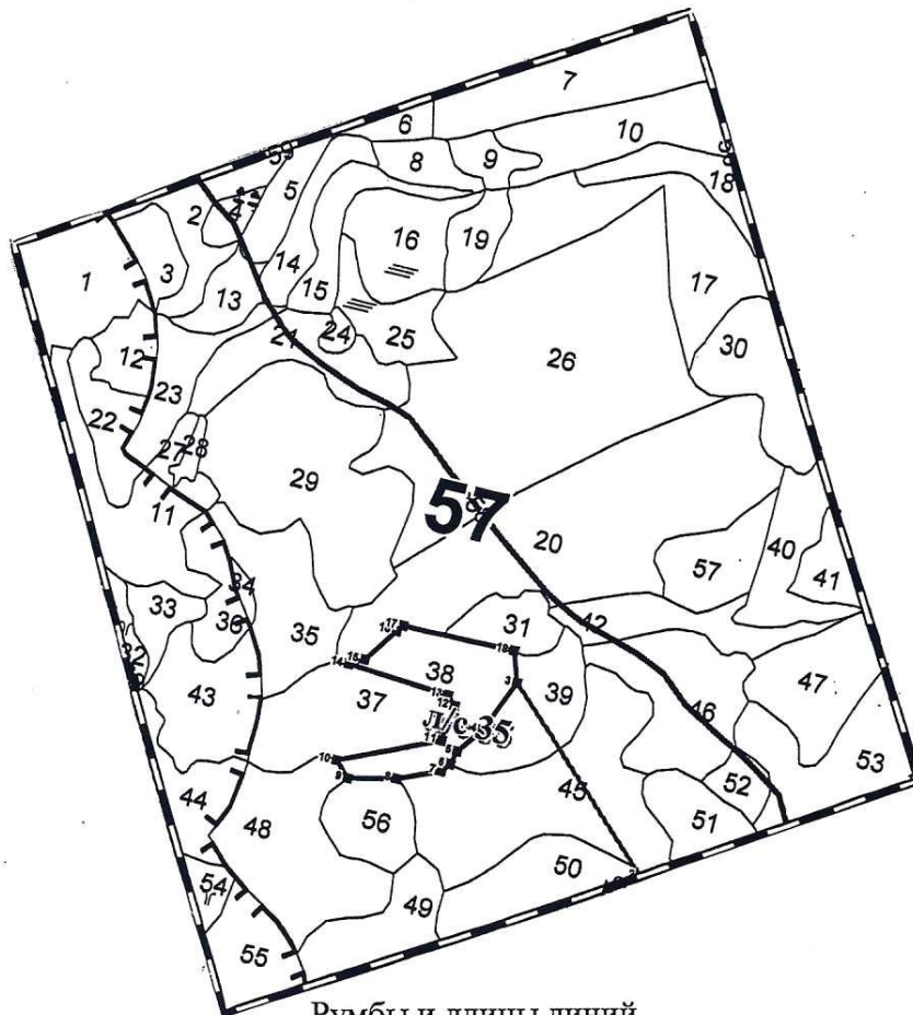
Румбы и длины линий