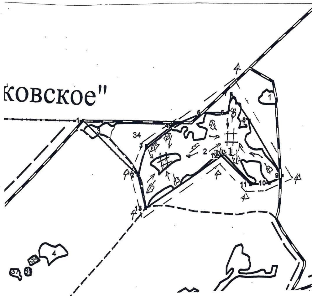
Схема (схемы) выполнения технологических операций по видам мероприятий ухода за лесами