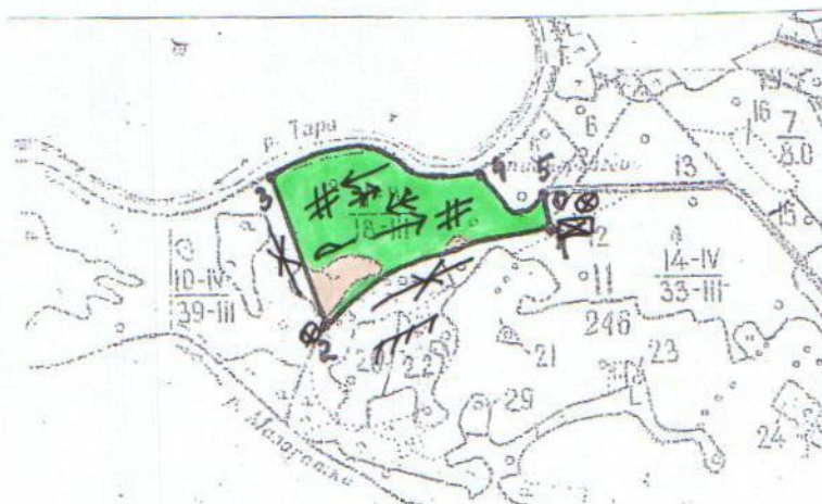
Схема (схемы) выполнения технологических операций по видам мероприятий ухода за лесами