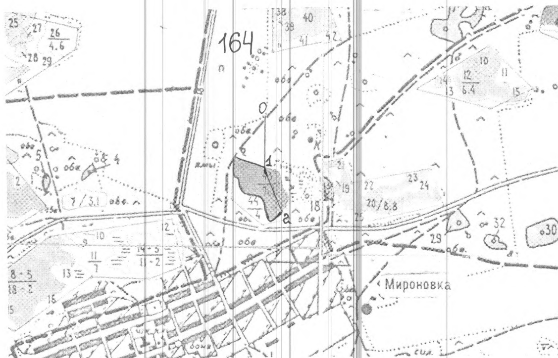
Румбы и длины линий